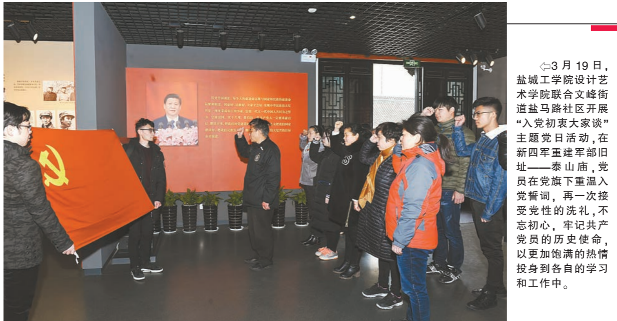
3月19日,盐城中行设计艺术学院联合文峰街道盐马路社区开展“入党初体验”主题党日活动,在新四军重建军部旧址——泰山庙,党员在党旗重温入党誓词,再一次接受党性的洗礼,不忘初心,牢记使命,以更加饱满的热情投身到各自的学习和工作中。